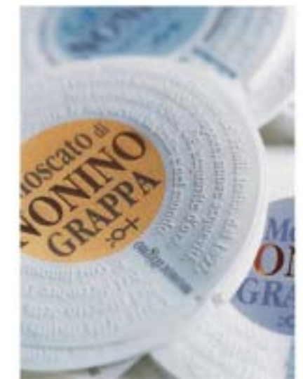
Merci à Fabrice, qui nous a aidés à réaliser ce reportage.