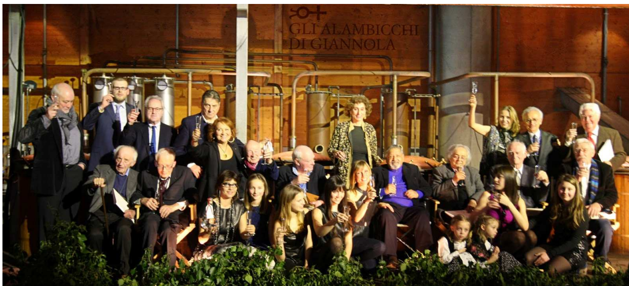
Nonino Preis 2014