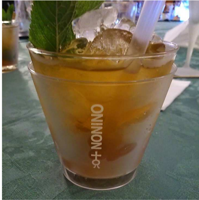
Nonino Frozen (Amaro Nonino Quintessentia, Sodawasser, Limette, Zucker, Minzblätter)

Bei diesen Gelegenheiten sind die Cocktails (sic) von Nonino mit ihren fantasievollen Namen und Zutaten unentbehrlich: Passion Nonino (z. B. Grappa Nonino Cru Monovitigno Fragolino, weißer Cinzano, Aperol, Passionsfrucht-Saft, Rosensirup), Nonino Cool , Nonino Secret , Black Vino , Nonino Ginger , Dreaming Nonino , Sophisticated Lady , Nonino Sisters , Nonino Sweet Sensation , Grapiha , Nonino Libre , Negronino , Nonino Frozen , Sigaro Nonino , The Reanimator (besonders beliebt in den New Yorker Restaurants) und andere.