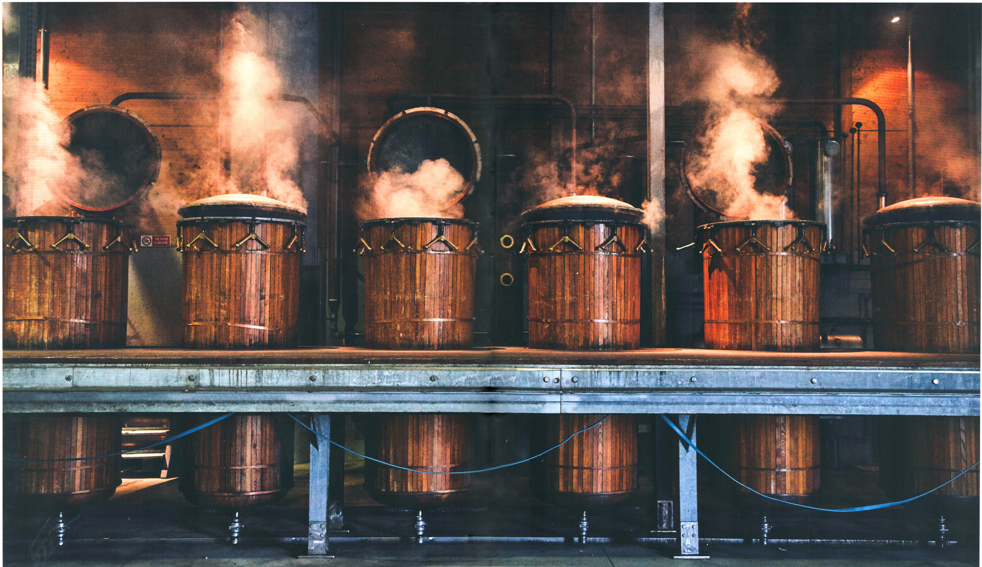
Wood and copper vats at Nonino Distillery