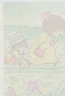
La famiglia Topini di Kazuo Iwamura

L'artista Kazuo Iwamura, scrittore e illustratore di libri per bambini, famoso in tutto il mondo per la serie La famiglia Topini , è morto il 19 dicembre scorso, nella sua casa a Mashiko, in Giappone ma la notizia è stata resa nota solo ora. Era nato a Tokyo il 3 aprile 1939. Dopo il diploma alla Tokyo University of the Arts, Kazuo Iwamura aveva cominciato a lavorare come illustratore nei programmi