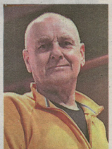
BENITO NONINO FONDATORE DELLA DINASTIA DEI DISTILLATORI FRIULANI

Krüger ha più di quaranta libri al suo attivo, spaziando tra poesie, racconti, romanzi, critica letteraria e traduzioni, tra cui quella delle poesie di Cesare Pavese. "Che cosa significa essere uno scrittore?" - si legge