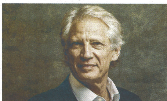
Dominique de Villepin